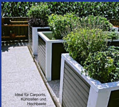
Ideal für Carports, Kühlzellen und Hochbeete