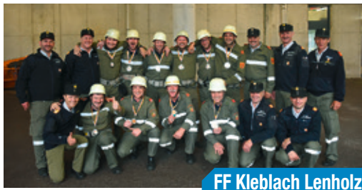
FF Kleblach Lenholz