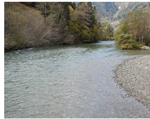
Die Möll: bis zu 8 m 3 im Sommer.