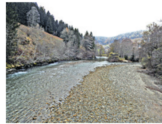
Die Möll: bis zu 4 m 3 im Winter.